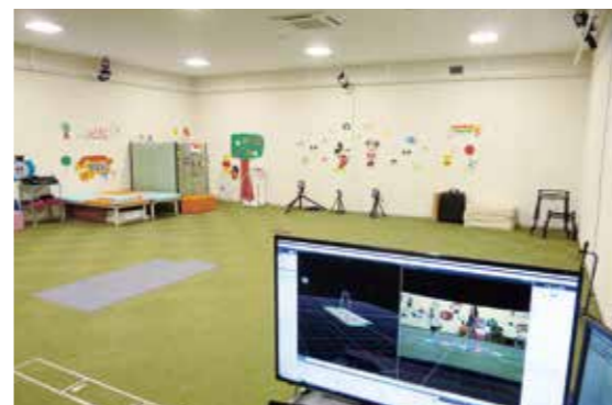
三次元動作解析室の室内

また、名古屋大学医学部との共同研究による臨床研究、企業と名古屋工業大学と連携して歩行支援機器の開発の協力をしています。