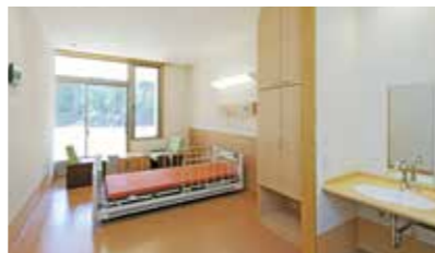
居室はベッド・フローリング・畳の3タイプ