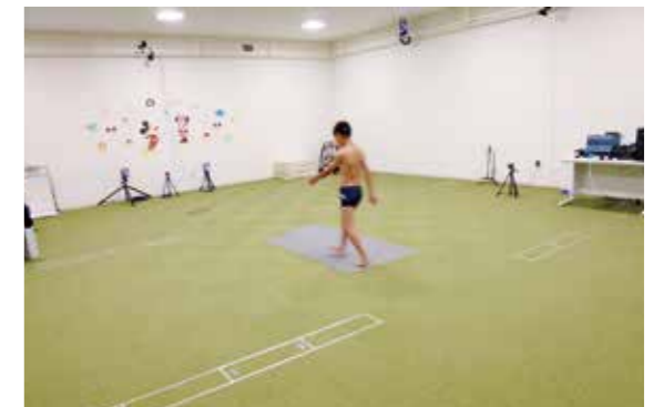
歩行分析検査の様子